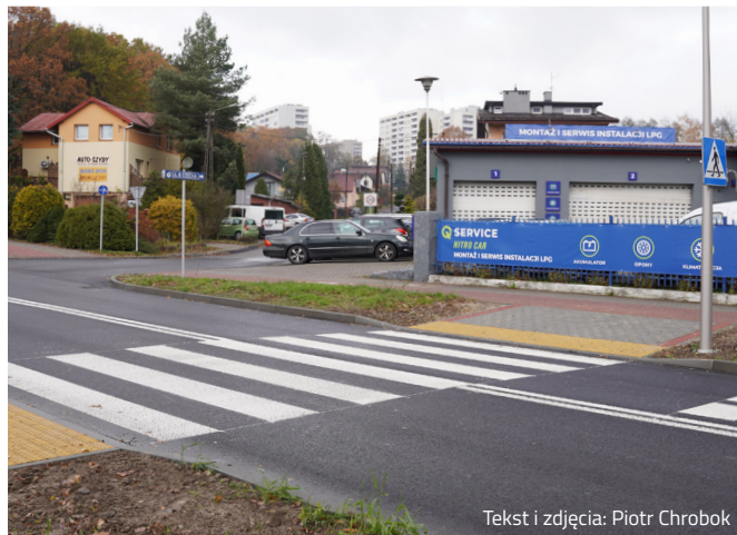
Tekst i zdjęcia: Piotr Chrobok