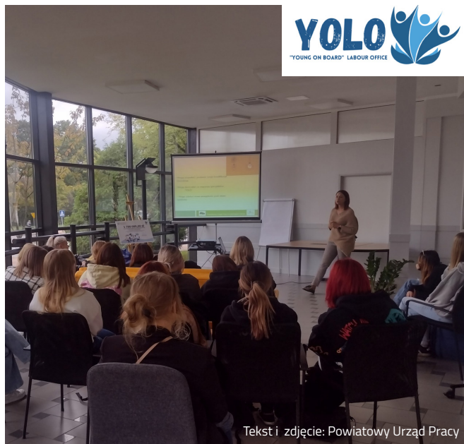
Tekst i zdjęcie: Powiatowy Urząd Pracy

board” Labour Office. Jedną z form wsparcia YOLO jest bezpłatne doradztwo prawne oraz konsultacje z zakresu pomocy społecznej. Wszystkie osoby zainteresowane zapraszamy do umawiania wizyt telefonicznie: 606 651 246, 606 649 879 lub mailowo yolo@pupjastrzebie.pl.