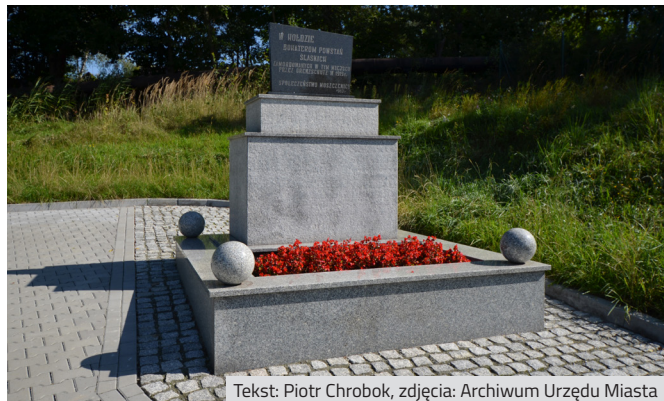
Tekst: Piotr Chrobok

Tuż obok Parku Zdrojowego, przy ul. Witczaka od strony Placu Zdrojowego znajduje się kolejna tablica upamiętniająca ofiary marszu śmierci podczas ewakuacji obozu Auschwitz-Birkenau. W Szerokiej przy KWK „Borynia” wzniesiono pomnik ku czci mieszkańców, którzy zginęli podczas II wojny światowej. A na ścianie kościoła w Zdroju, przy ul. 1 Maja znaleźć można tablicę upamiętniającą księży dekanatu Jastrzębie, którzy stracili życie w latach 1939-1945.