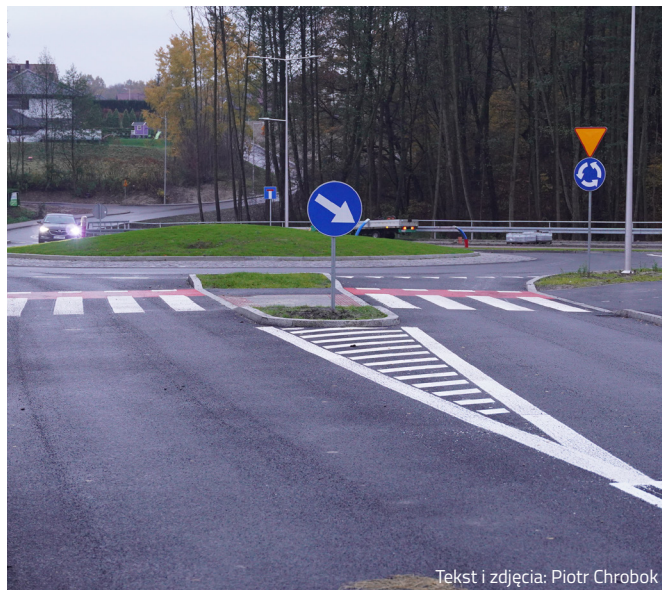
Tekst i zdjęcia: Piotr Chrobok

Koszt prac wyniósł ponad 10 milionów złotych. Nasze miasto otrzymało na nią dofinansowanie w wysokości ponad 8 mln zł.