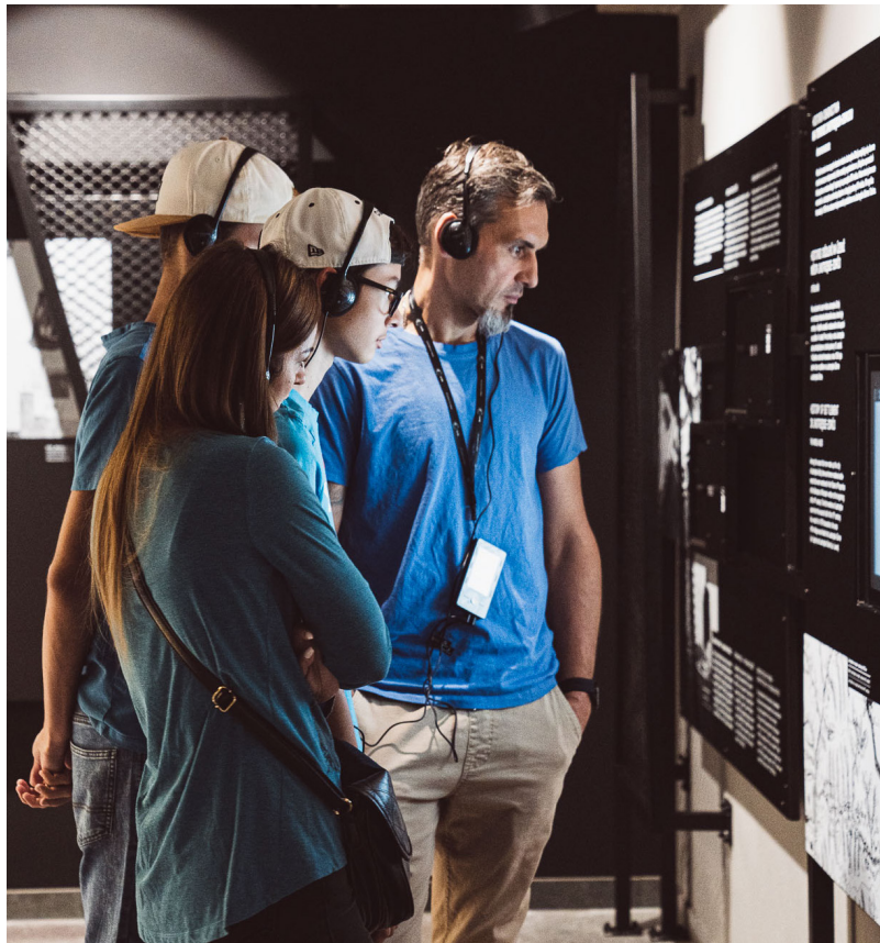
Tekst: Instytut Dziedzictwa i Dialogu – Łaźnia Moszczenica, zdjęcie: Instytut Dziedzictwa i Dialogu – Łaźnia Moszczenica

Ze względu na duży walor edukacyjny wystawy, ważną grupą odbiorców są uczniowie szkół podstawowych i średnich. Dlatego też Instytut przygotował specjalny pakiet merytoryczny ułatwiający przeprowadzenie w Carbonarium lekcji interdyscyplinarnej. Dostępny jest on m.in. na stronie: www.lazniamoszczenica.pl w zakładce „oferta edukacyjna”.