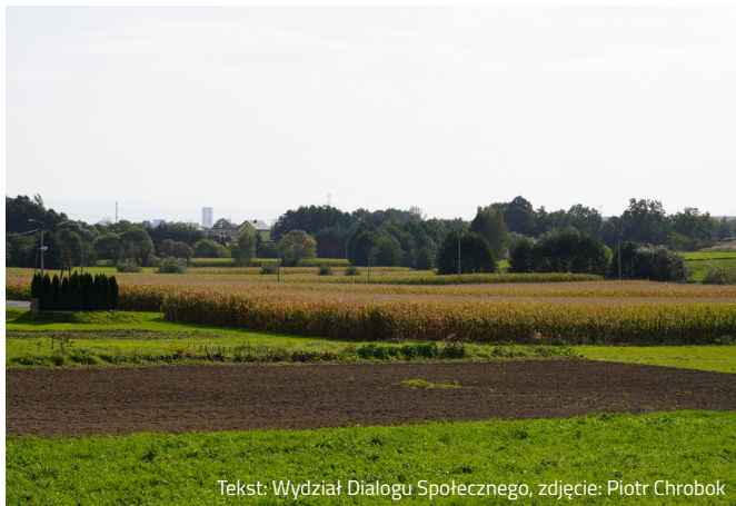
Tekst: Wydział Dialogu Społecznego

Fundusz sołectki jest formą budżetu partycypacyjnego. Są to pieniądze wyodrębnione w budżecie gminy, o wydatkowaniu których decydują bezpośrednio mieszkańcy poszczególnych sołectw. Pieniądze mają służyć poprawie warunków życia mieszkańców sołectw.