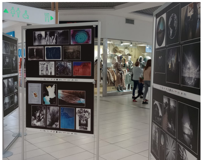
Tekst: Piotr Chrobok

Szczegółowe informacje dotyczące festiwalu dostępne są natomiast pod adresem: https://www.facebook.com/OFFO.Festiwal/