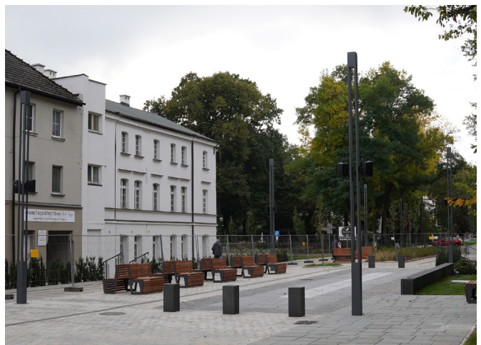
Tekst: Piotr Chrobok

Ciekawostką jest fakt, że obecna ul. 1 Maja, jako Paulastrasse była otoczonym zielenią deptakiem. I wkrótce obecna ul. 1 Maja ma nawiązać do swojego pierwotnego charakteru za sprawą budowanego deptaka. Ten jest już niemal gotowy. W mieście panuje głębokie przekonanie, że dzięki niemu, niczym za najlepszych uzdrowiskowych lat, Zdrój znów będzie się rozwijał, a zwłaszcza znajdujące się przy ul. 1 Maja restauracje, czy hotele.