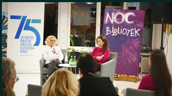
Tekst: Piotr Chrobok