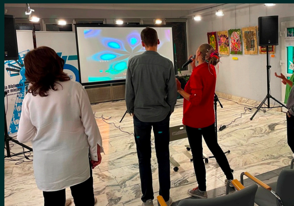
Tekst: Piotr Chrobok

Najbardziej klimatyczną atrakcją był chyba jednak nocny spływ kajakowy, który odbył się na rzece Szotkówce i podczas którego jego uczestnikom trasę rozświetlały płonące pochodnie.