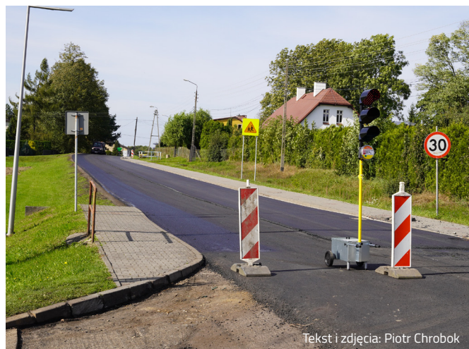
Tekst i zdjęcia: Piotr Chrobok