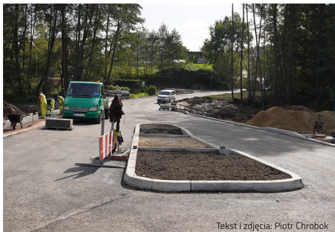
Tekst i zdjęcia: Piotr Chrobok