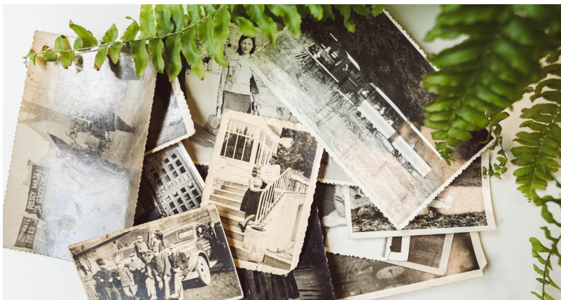
Tekst: Instytut Dziedzictwa i Dialogu – Łaźnia Moszczenica

Egzemplarze kopii wzorcowych zostaną przekazane do repozytoriów - właściwych Centrów Kompetencji w zakresie digitalizacji, tj. Narodowego Archiwum Cyfrowego oraz Narodowego Instytutu Muzealnictwa i Ochrony Zbiorów. Ponadto kopie części zdigitalizowanych obiektów zostaną przekazane do Śląskiej Biblioteki Cyfrowej. Koszt projektu 180 000 złotych. Wkład własny wyniósł 45 000 złotych, zaś kwota dofinansowania 130 000 złotych.