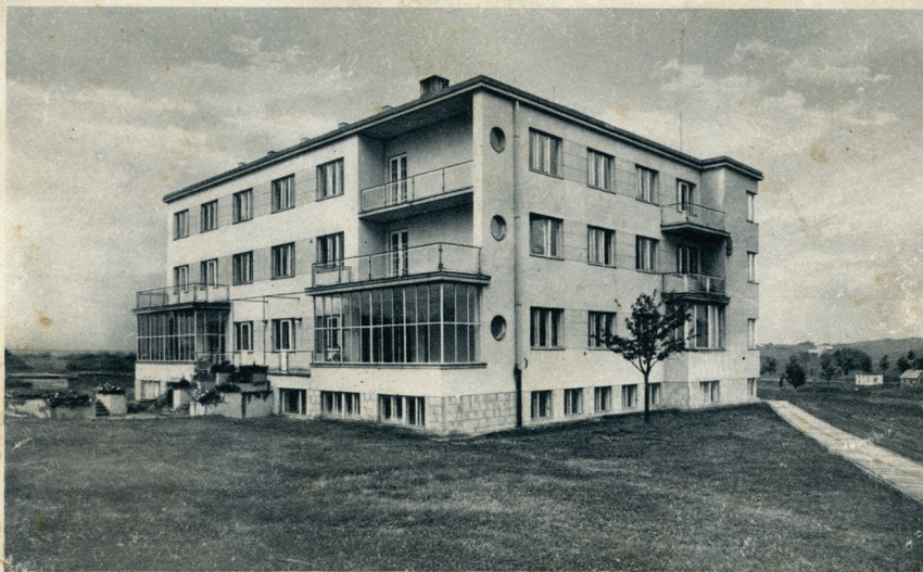
Erholungsheim der Baidon-Friedenshütte