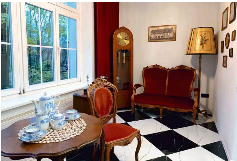
Fragment wystawy o historii jastrzębskiego uzdrowiska