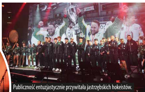
Publiczność entuzjastycznie przywitała jastrzębskich hokeistów.