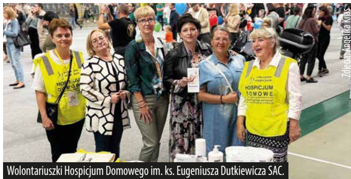
Wolontariuszki Hospicjum Domowego im. ks. Eugeniusza Dutkiewicza SAC.

Podczas licytacji udało się zebrać ponad 15 210 złotych, które zostaną przeznaczone na zakup niezbędnego sprzętu dla Hospicjum Domowego im. ks. Eugeniusza Dutkiewicza SAC. Uczestnicy oddali także ponad 10 litrów krwi podczas towarzyszącej wydarzeniu akcji krwiodawstwa.