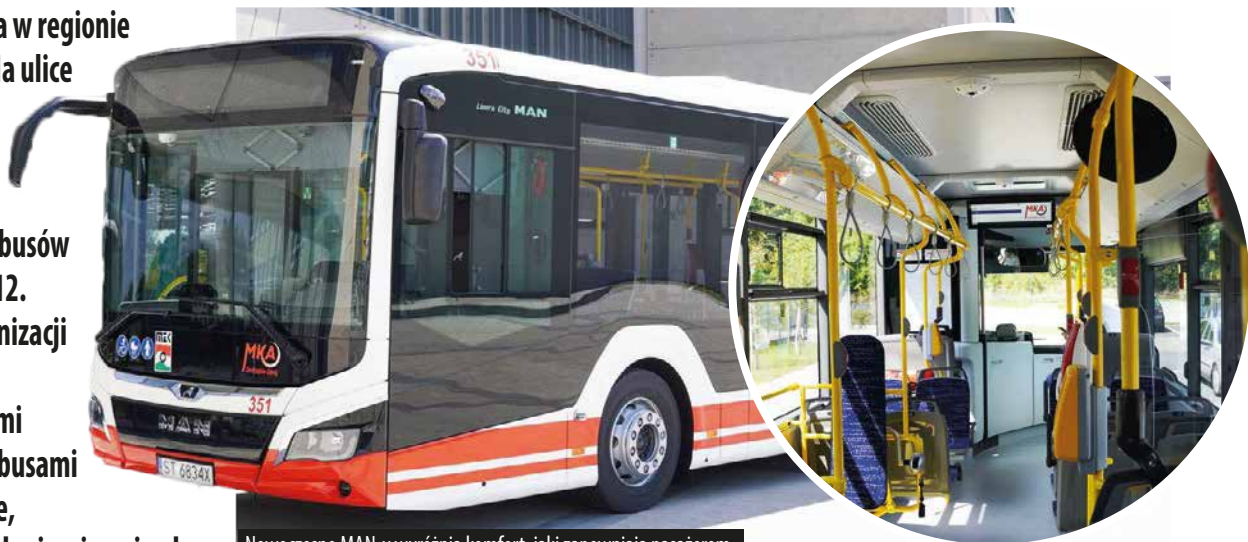
Nowoczesne MAN-y wyróżniają komfort, jaki zapewniają pasażerom.

10 nowoczesnych autobusów marki MAN Lion's City 12. To kolejny etap modernizacji taboru, który - razem z wcześniej zakupionymi 14 elektrycznymi autobusami - daje w sumie 24 nowe, zaawansowane technologicznie pojazdy.