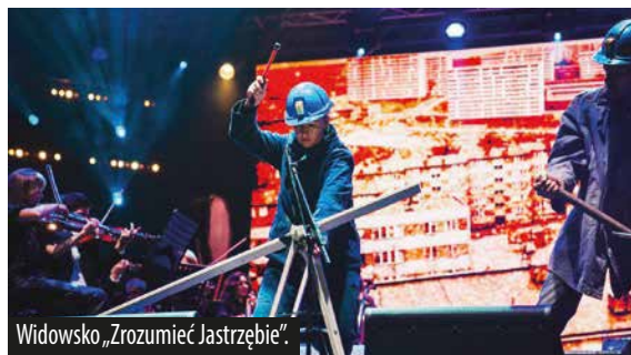
Widowisko „Zrozumieć Jastrzębie”.

Podziękowania należą się Instytutowi Dziedzictwa i Dialogu Łażnia Moszczenica za znakomitą organizację, artystom za niezapomniane występy, a przede wszystkim mieszkańcom Jastrzębia-Zdroju - za obecność, energię i wyjątkową atmosferę.