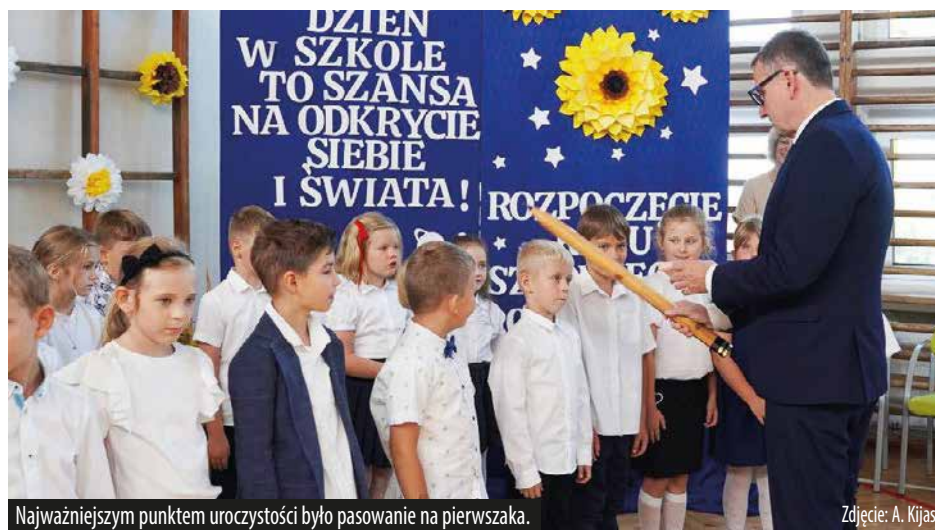
Najważniejszym punktem uroczystości było pasowanie na pierwszaka.

To już druga edycja realizowanych obecnie trzech projektów: „Krok w przyszłość z doświadczeniem!” dla uczniów ZS nr 2, którego budżet wynosi ponad 2 mln zł, z czego prawie 1,8 mln zł to unijne wsparcie; „Dogonić zawód” dla uczniów ZSTB i ZS5 z budżetem ponad 900 tys. zł i dofinansowaniem około 770 tys. zł oraz „Akcja Staż!” wspierający ZS nr 6, z budżetem ponad 1,6 mln zł i unijnym wsparciem ponad 1,3 mln zł.