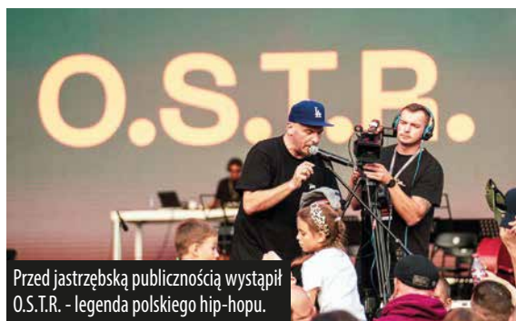
Przed jastrzębską publicznością wystąpił O.S.T.R. - legenda polskiego hip-hopu.