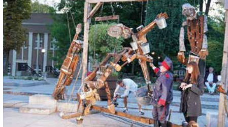
Walny Teatr - spektakl „Szekspir made in Poland”