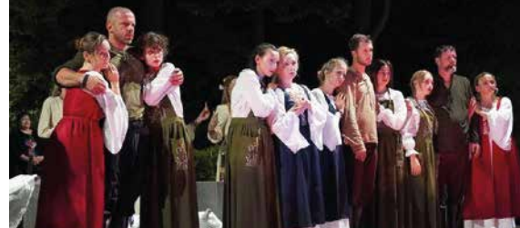
Teatr Cordis - „Tryptyk - legenda źródeł jastrzębskich cz. 3”