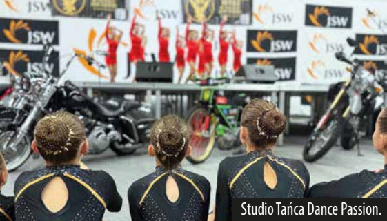
Studio Tańca Dance Passion.