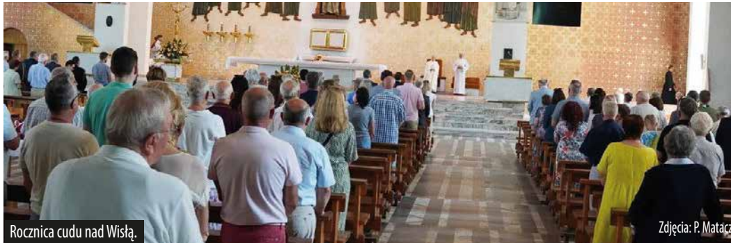
Rocznica cudu nad Wisłą.

W Jastrzębiu-Zdroju z okazji najważniejszych świąt państwowych odprawiana jest uroczysta msza św. w kościele pw. NMP Matki Kościoła. Nie inaczej było 15 sierpnia, w dniu Święta Wojska Polskiego.