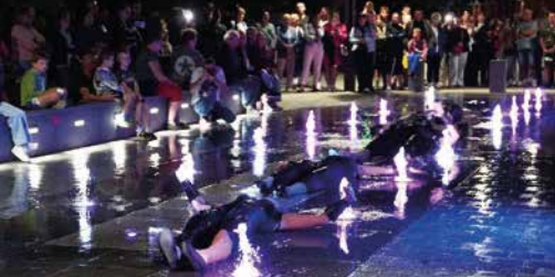
Teatr Cordis - „Tryptyk - legenda źródeł jastrzębskich cz. 3”