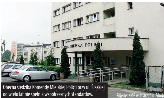
Obecna siedziba Komendy Miejskiej Policji przy ul. Śląskiej od wielu lat nie spełnia współczesnych standardów.

Radni jednogłośnie opowiedzieli się za budową nowego obiektu oraz za wystosowaniem apelu do Ministra Spraw Wewnętrznych i Administracji o ujęcie tej inwestycji w rządowym „Programie modernizacji Policji, Straży Granicznej, Państwowej Straży Pożarnej i Służb Ochrony Państwa na lata 2026-2029”. Nie ma wątpliwości, że obecna siedziba Komendy Miejskiej Policji przy ul. Śląskiej od wielu lat nie spełnia współczesnych standardów - zarówno technicznych, jak i lokalowych.