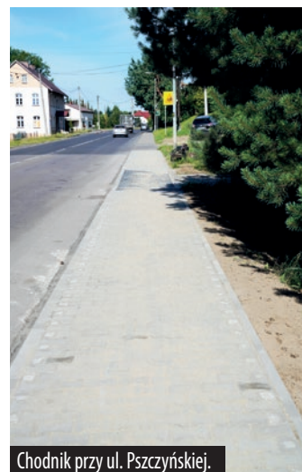
Chodnik przy ul. Pszczyńskiej.

Chodnik przy ul. Pszczyńskiej powstał w ramach Jastrzębskiego Budżetu Obywatelskiego. Prace objęły 53-metrowy odcinek o szerokości 1,5 metra. Stara nawierzchnia została zastąpiona nową - wykonaną z kostki brukowej, ułożoną na istniejącej podbudowie tłuczniowej. Łączna powierzchnia wyremontowanego chodnika to 79,5 m 2 , a koszt realizacji wyniósł 32 960 zł.