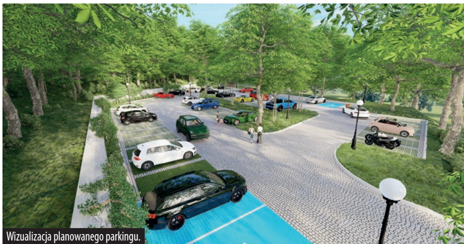
Wizualizacja planowanego parkingu.