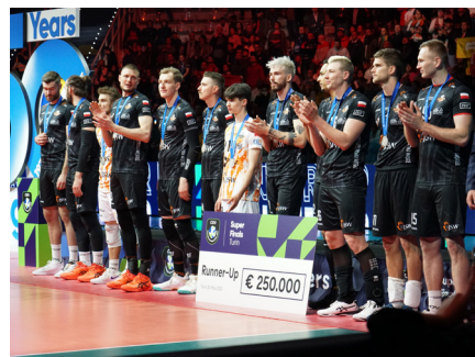
Tekst: Dominika Głądała