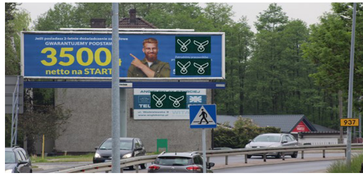
Czy nasze miasto tak ma wyglądać?