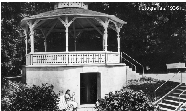
Fotografia z 1936 r.

W samym sercu Parku Zdrojowego znajduje się wyjątkowy budynek, który pełnił w dawnym uzdrowisku istotną funkcję. To ówczesna pijalnia wód – teraz popularna kawiarenka letnia. Kiedyś było to miejsce dystrybucji wody solankowej, ale również przestrzeń życia towarzyskiego. Właściciele uzdrowiska bardzo dbali o wygląd budynku, co sprawiało, że kuracjusze chętnie spędzali czas w jego otoczeniu. Dzisiaj kawiarenka jest jedną z piękniejszych wizytówek naszego miasta.