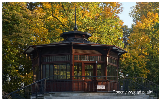
Obecny wygląd pijalni.

pawilon z tarasem. W czasie II wojny światowej budynek uległ zniszczeniu, natomiast po jej zakończeniu, odbudowano wiele dawnych budynków uzdrowiskowych. W lipcu 1948 roku wyremontowaną i nieco przekształconą pijalnię wód oddano do użytku. Do czasów współczesnych zachowało się oryginalne symetryczne ukształtowanie terenu ze skarpami, schodami terenowymi i półkolistym placzykiem przed dawnym wejściem na dolny poziom, jak również międzywojenna stolarka okienna z podziałem na drobne, prostokątne pola, a także lada.