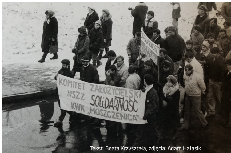
Tekst: Beata Krzysztafa

Całe życie pana Adama było pełne różnorodnych doświadczeń. Przeżył wiele pięknych chwil i zapamiętał wiele niezwykłych historii z czasów swojego dzieciństwa. Mieszkanie w Jastrzębiu-Zdroju przez wiele lat zapewniło mu sporo radości i wspomnień. Teraz, będąc już w wieku dojrzałym, patrzy z sentymentem na tamte czasy i cieszy się, że mógł być częścią tej wspaniałej społeczności.