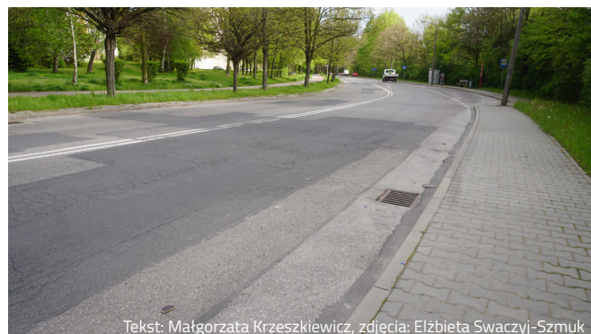
Tekst: Małgorzata Krzeszkiewicz

Wartość inwestycji to blisko 3 mln złotych, na realizację tego przedsięwzięcia miasto pozyskało środki w wysokości niespełna 1,4 mln zł w ramach Rządowego Funduszu Rozwoju Dróg.