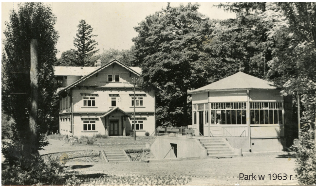
Park w 1963 r.

Pijalnię wód wzniesiono w 1861 roku. Obiekt początkowo został wybudowany w stylu uzdrowiskowym. Postawiono go na ośmiobocznym murowanym cokole zagłębionym poniżej poziomu otaczającego go terenu. Przed wejściem znajdował się placzyk, a na wyższej kondygnacji drewniana ażurowa altana z dachem, która służyła jako taras dla orkiestry.