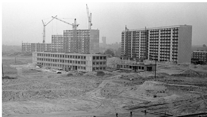
Tekst: Instytut Dziedzictwa i Dialogu – Łażnia Moszczenica