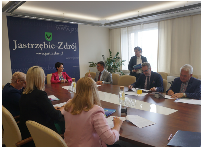
Tekst: Powiatowy Urząd Pracy w Jastrzębiu-Zdroju

Jastrzębski projekt będzie realizowany pod nazwą YOLO „Young on board” Labour Office .