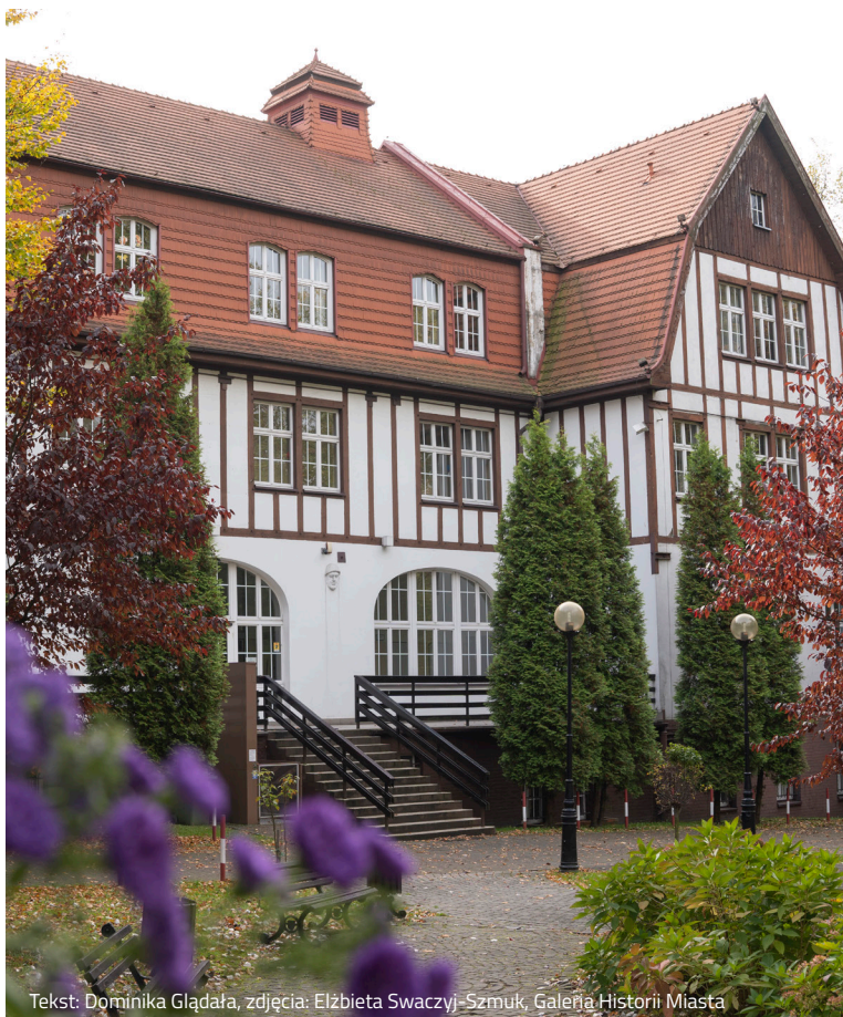
Tekst: Dominika Gładka