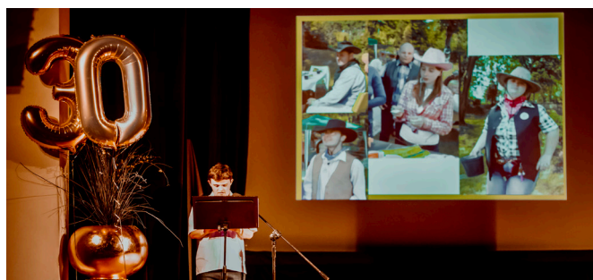
Tekst: Małgorzata Krzeszkiewicz