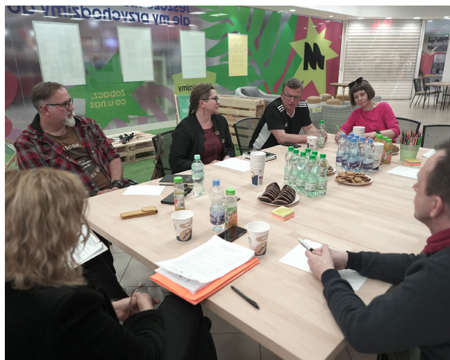
Tekst i zdjęcia: Instytut Dziedzictwa i Dialogu – Łaźnia Moszczenica