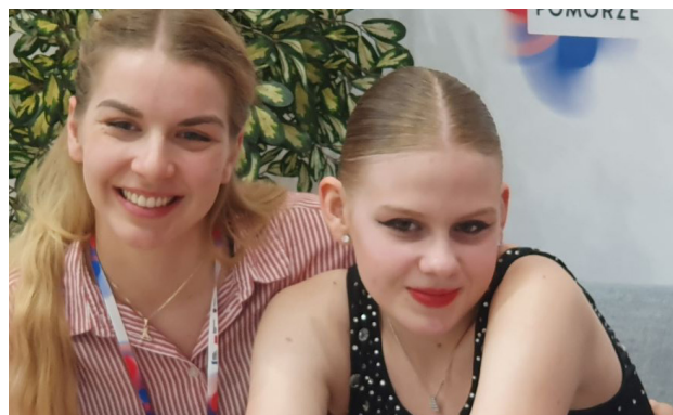
Tekst: Beata Krzyształa

Choć sezon rolkarski powoli dobiega końca, Zuzanna nie zamierza odpoczywać. Niedawno została powołana do Kadry Narodowej. Będzie startować w Mistrzostwach Europy, które odbędą się we Włoszech.