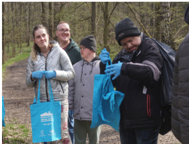
Tekst: Ośrodek Pomocy Społecznej