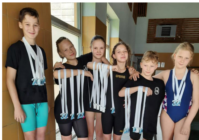
Tekst: Beata Krzyształa

Gratulujemy wszystkim zawodnikom i wspieramy w dalszych sukcesach.