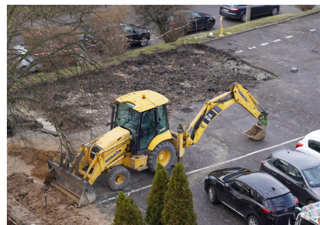
Tekst i zdjęcia: Małgorzata Krzeszkiewicz

W ramach zadań „Wykorzystania odnawialnych źródeł energii” planowane są kolejne inwestycje. Przewidujemy montaż paneli słonecznych na budynkach kolejnych szkół, żłobka, przedszkoli, biblioteki i obiektach podległych Urzędowi Miasta.