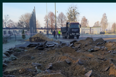
Tekst Elżbieta Swaczyj-Szmuk

kompleksu boisk sportowych wraz z pozostałym zagospodarowaniem terenu SP nr 18”. Wykonanie nowego wielofunkcyjnego boiska to zapewnienie bezpieczeństwa dzieciom i młodzieży. Zadanie ma na celu aktywację lokalnej społeczności, w tak ważnym aspekcie jak zdrowie, kultura fizyczna i rodzinne spędzanie wolnego czasu. Zakończenie zadania zaplanowano na czerwiec 2023 roku.