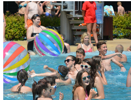
Tekst: Dominika Głądała