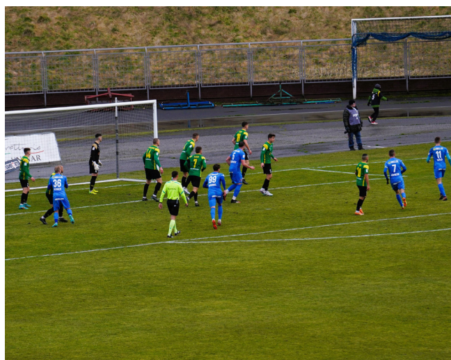
Tekst: Beata Krzyształa