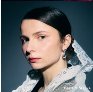
DARIA ZE ŚLĄSKA