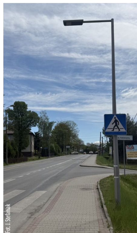
Fot. J. Stefanik