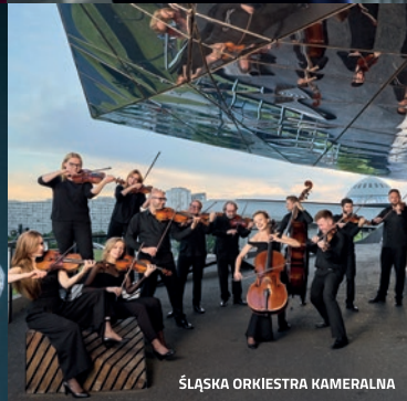
ŚLĄSKA ORKIESTRA KAMERALNA