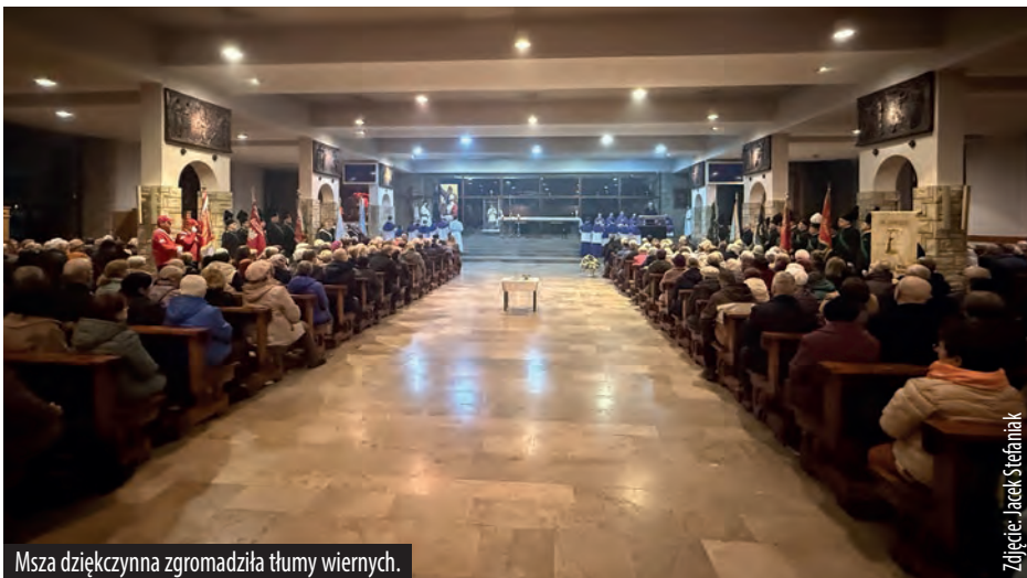
Msza dziękczynna zgromadziła tłumy wiernych.

Nowo mianowany ekonom archidiecezji katowickiej będzie odpowiedzialny za zarządzanie dobrami materialnymi Kościoła, nadzór nad finansami, inwestycjami oraz instytucjami go-